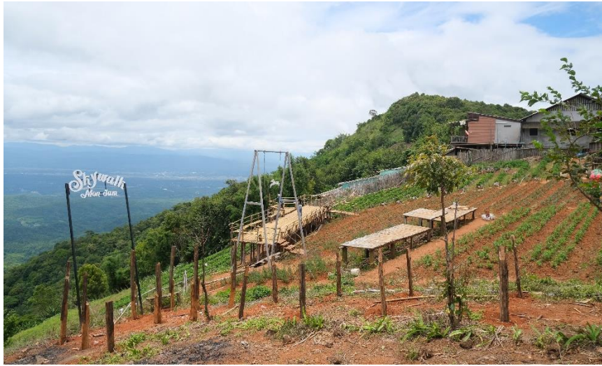
ภาพที่ 4 การพัฒนาพื้นที่เป็นแหล่งท่องเที่ยวในพื้นที่ดอยม่อนแจ่มของโครงการหลวงหนองหอย

4 ส่งเสริมธุรกิจการท่องเที่ยวชุมชนและทักษะการบริการนักท่องเที่ยวในพื้นที่โครงการหลวงหนองหอย จากการศึกษาข้อมูลหน่วยงานภาครัฐในแนวทางการส่งเสริมธุรกิจการท่องเที่ยวชุมชนและทักษะการบริการนักท่องเที่ยวในพื้นที่โครงการหลวงหนองหอย พบว่า (เจ้าหน้าที่ภาครัฐ เทศบาลแม่แจ่ม อำเภอแมริม จังหวัดเชียงใหม่, 6 ตุลาคม 2564)