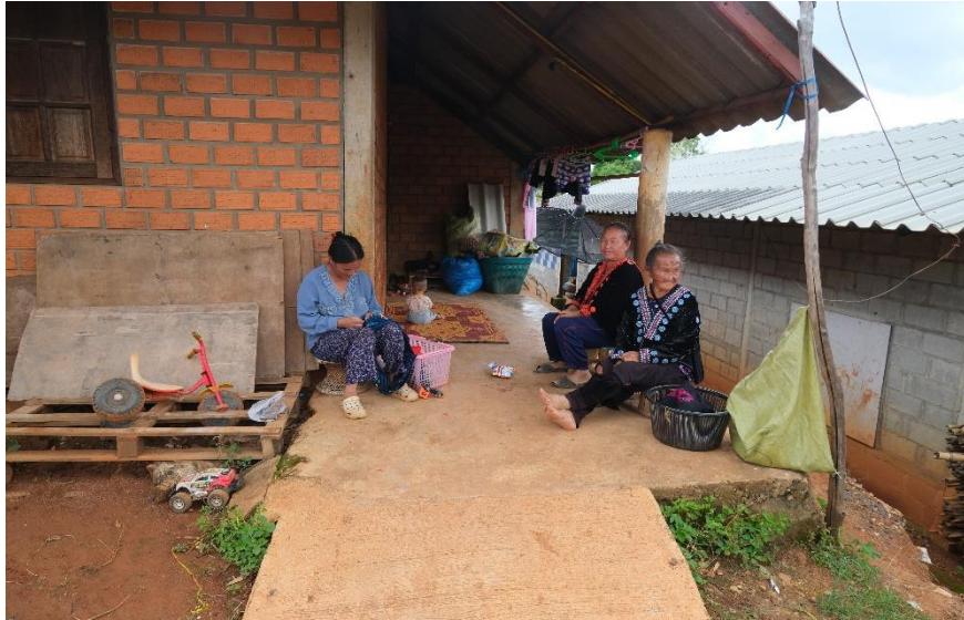
ภาพที่ 2 การแต่งกายชาติพันธุ์ม้งในพื้นที่ของบ้านหนองหอยเก่า บ้านหนองหอยใหม่ บ้านแม่ชิ - ปางไฮ และบ้านห้วยห้วย

จากปัญหาดังกล่าวทำให้เห็นภาพว่าปัจจุบันพื้นที่บ้านหนองหอยเก่า บ้านหนองหอยใหม่ บ้านแม่ชิ - ปางไฮ และบ้านห้วยห้วย ได้เปลี่ยนวิธีการผลิตแบบการทำเกษตรแบบดั้งเดิมสู่เกษตรเชิงพาณิชย์เป็นที่เรียบร้อยแล้ว แต่คำถามที่ตามมาคือ โครงการหลวงและหน่วยงานภาครัฐได้ให้ความช่วยเหลือหรือส่งเสริมชาวบ้านที่เป็นเกษตรกรนี่ยังไร ในบทความวิจัยฉบับนี้จึงได้รวบรวมข้อเสนอที่เกิดขึ้นจากภาครัฐและชาวบ้านในพื้นที่กล่าว คือ