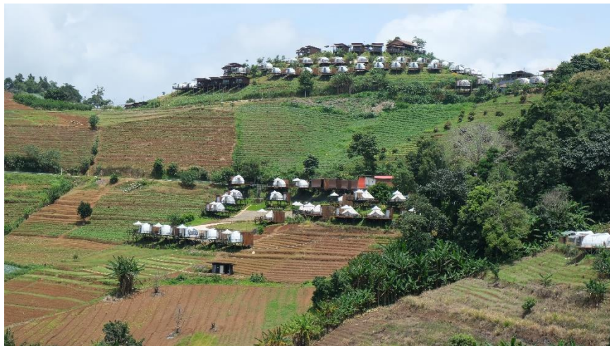
ภาพที่ 1 สภาพทั่วไปของพื้นที่ของบ้านหนองหอยเก่า บ้านหนองหอยใหม่ บ้านแม่ชี - ปางไฮ และบ้านห้วยห้วย