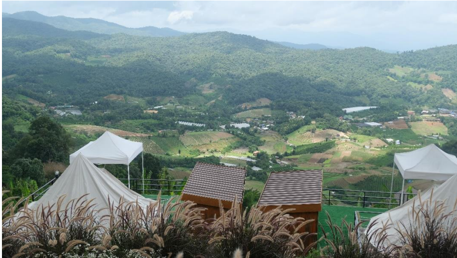
ภาพที่ 5 การพัฒนาพื้นที่กลายเป็นแหล่งท่องเที่ยวและที่พักในการรองรับนักท่องเที่ยว