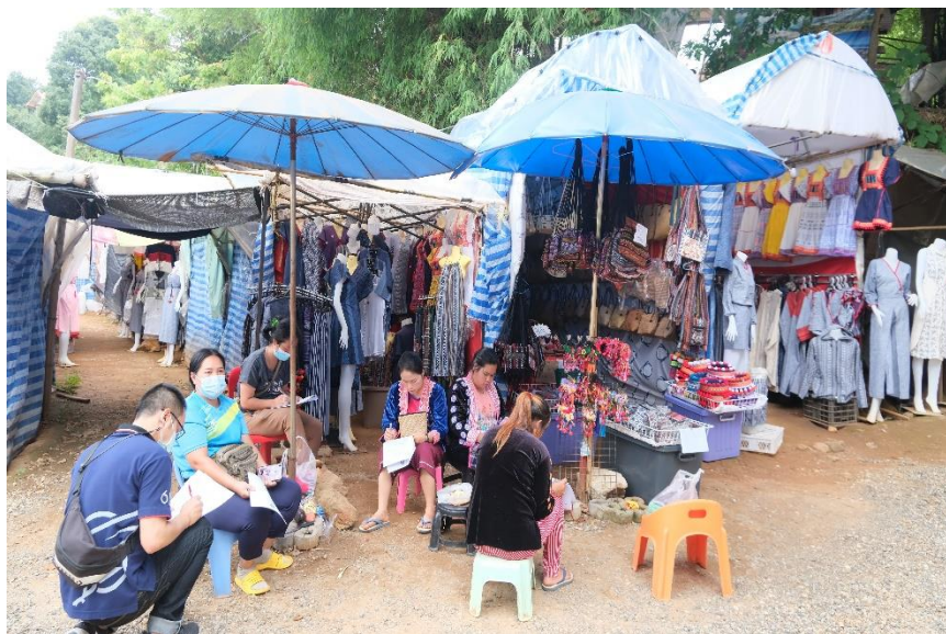
ภาพที่ 3 การจำหน่ายผลิตภัณฑ์พื้นถิ่นในบริเวณดอยม่อนแจ่มของโครงการหลวงหนองหอย

บทสัมภาษณ์ข้างต้นในประเด็นการพัฒนาวิสาหกิจชุมชนและเครือข่ายชุมชนในการพัฒนาแหล่งท่องเที่ยวพื้นที่โครงการหลวงหนองหอย นำไปสู่ข้อเสนอแนะเชิงนโยบายเพื่อพัฒนาพื้นที่ให้มีรายได้เพิ่มมากขึ้น รวมไปถึงการบริหารจัดการเกี่ยวกับการรองรับนักท่องเที่ยว อย่างไรก็ตาม ตัวแสดงที่สำคัญในการพัฒนาประเด็นนี้ก็นำไปสู่ความเข้มแข็งของวิสาหกิจชุมชนและเครือข่ายชาวบ้านทั้งในเรื่องสินค้าการเกษตรและธุรกิจการท่องเที่ยวจำเป็นต้องอาศัยความร่วมมือจากชาวบ้าน โครงการหลวง องค์กรปกครองส่วนท้องถิ่น และหน่วยงานภาครัฐส่วนอื่น ๆ ที่เกี่ยวข้อง ด้วยเหตุนี้ วิสาหกิจชุมชนจึงไม่ใช่เป็นเพียงการรวมกลุ่มของชาวบ้านในพื้นที่โครงการหลวงหนองหอยแต่ถ้าทุกฝ่ายร่วมมือกันอย่างจริงจัง วิสาหกิจชุมชนนี้จะกลายเป็นตัวขับเคลื่อนให้ชาวบ้านมีคุณภาพชีวิตที่ดีกว่าเดิมและเป็นใบเบิกทางสู่โอกาสในด้านต่าง ๆ อย่างที่เห็นได้ชัด คือ การเข้าถึงเรื่องการศึกษาที่บทสัมภาษณ์สะท้อนให้เห็นว่าการมีโอกาสได้ส่งบุตรหลานเข้ามาเรียนในเมืองแพร่ผันตามรายได้