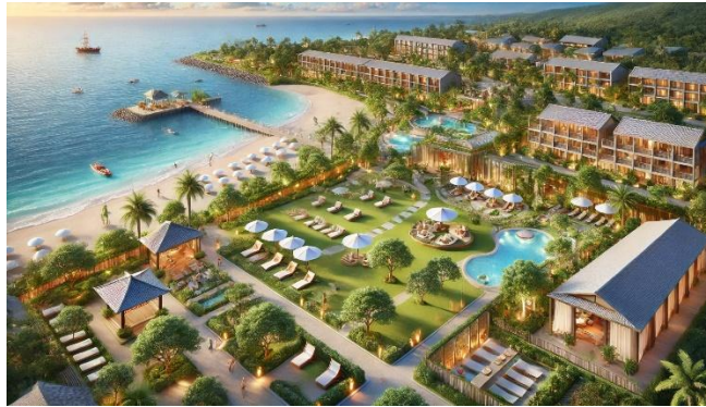
ภาพที่ 1 ความต้องการในการจัดการภูมิทัศน์ของโรงแรมริมทะเลในด้านองค์ประกอบทางกายภาพ ภาพนี้ประมวลโดยการใช้เว็บไซต์ www.chatgpt.com