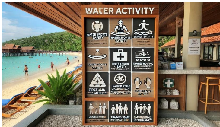
ภาพที่ 3 ความต้องการของนักท่องเที่ยวต่อการจัดการภูมิทัศน์ในโรงแรมริมทะเล ในด้านสิ่งอำนวยความสะดวกและความปลอดภัย