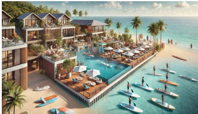
ภาพที่ 2 ความต้องการของนักท่องเที่ยวต่อการจัดกิจกรรมในโรงแรมริมทะเล ภาพนี้ประมวลโดยการใช้เว็บไซต์ www.chatgpt.com